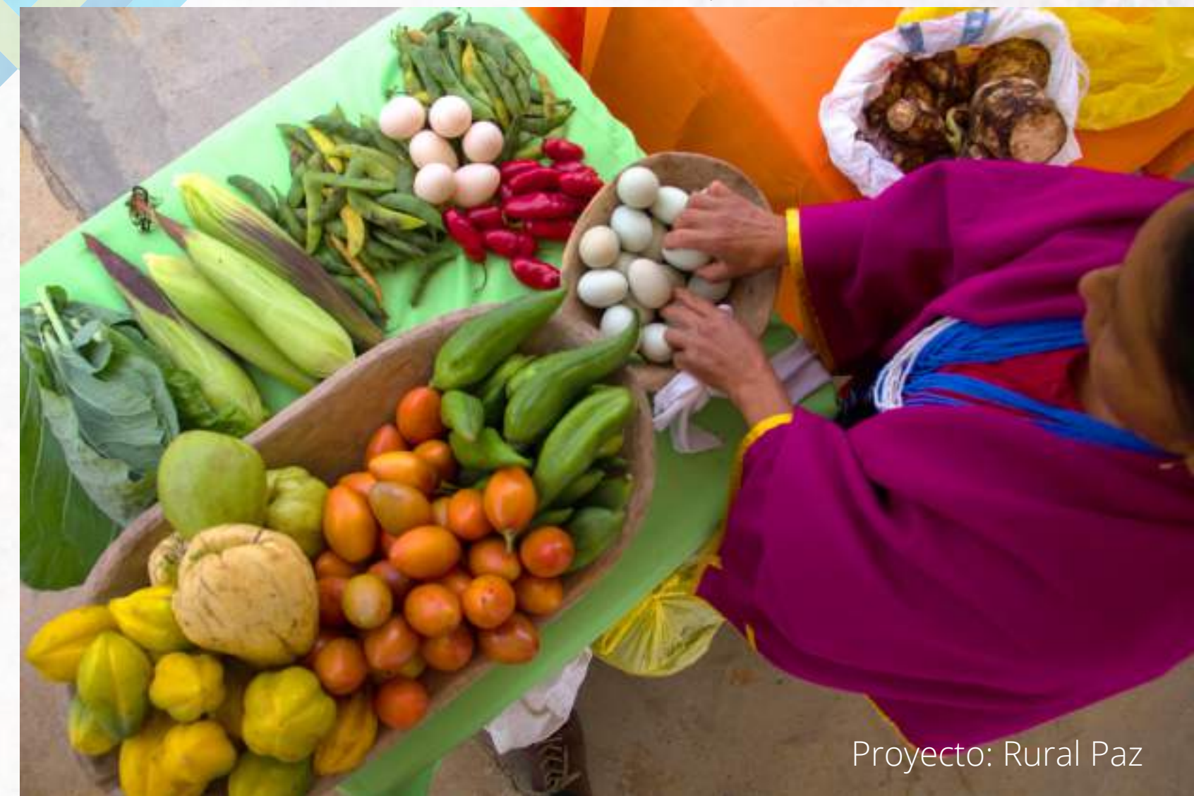
Proyecto: Rural Paz