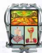
Municipio de Ipiales