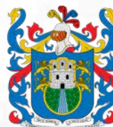
Municipio de Pasto